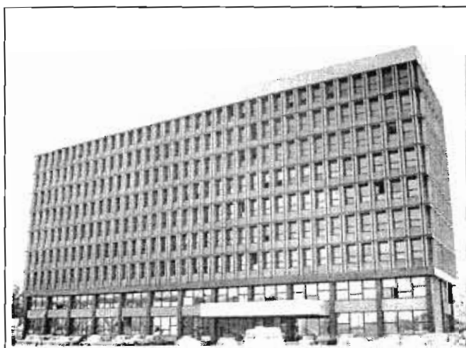
Clădirea Institutului de Studii și Proiectări Agricole ISPA – care așteaptă reînființarea pe Bd. Expoziției

○ Lipsa unei strategii și a unei politici agrare bazate pe funcțiile pieții pentru o finanțare substanțială