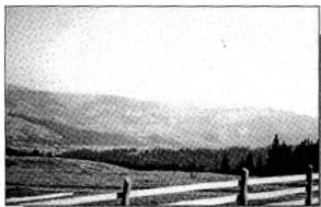
Țara Dornelor, unde numai paștile și pădurea au rămas ca resurse pentru traiul populației

○ Dar lucrurile nu se opresc aici. Odată cu apariția programului SAPARD în anii 2000-2002, Jean Valvis circula la Ministerul Agriculturii ca la el acasă, reușind să obțină multe zeci de milioane de lei pentru rețehnologizare, și astfel se dotează noile secții cu tehnologie de ultimă generație. Dar după cei cinci ani prevăzuți în proiect, întreaga dotare cumpărată cu bani românești a fost transferată integral în alte țări, lăsând cele 6 secții comunale, adevărate fabrici, doar cu zidurile și plăcile exterioare ale programului SAPARD la vedere.