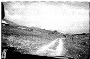
O stână cooperativă pentru oi și vaci pe muntele Suhard, care străjuiesc Vatra Dornei

○ Între timp, devenit și președintele patronatului laptelui din România, Jean Valvis a extins această practică monopolistă în tot arealul carpatic românesc. În acest proces a fost atras un secretar de stat (devenit consilier al Președintelui Traian Băsescu și președinte al Comisiei pentru elaborarea Cadrului strategic național pentru dezvoltarea durabilă a sectorului agroalimentar și a spațiului rural), care a devenit Director general la Jean Valvis, dându-și demisia din funcția de senator.