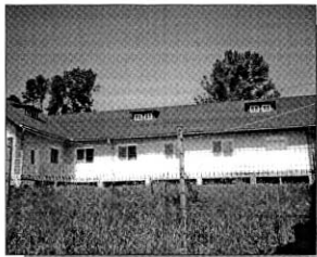
Fosta fabrică de swaitzer din Vatra Dornei

În același timp, este extrem de interesant faptul că a făcut toate eforturile de a cumpăra singurul abator comunal din zonă, căruia i-a dat altă destinație; în acest mod, au rămas fără abator peste 10.000 de gospodării țărănești într-o zonă izolată și revenirea la practicile de tip evul mediu, fără nici o supraveghere medicală și condiții de igienă precare pentru sănătatea publică. De ce a trebuit să cumpere și abatorul Jean Valvis, rămâne un mister!